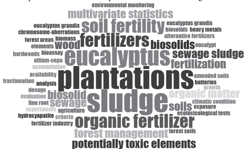
Figura 2 – Nuvem de palavras-chaves mais frequentes encontradas nos artigos utilizados nesta análise

As palavras-chave mais frequentes no texto foram: “ plantations ”, “ sludge ”, “ Eucalyptus ”, “ fertilizers ”, “ organic fertilizer ” e “ soil fertility ” (figura 2), indicando a relevância dessas palavras para pesquisas futuras sobre a aplicação do lodo de esgoto em plantios florestais de espécies de Eucalyptus .